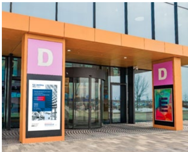
Рекламная конструкция входная группа, 1,15х1,75 м

Реклама на части фасадного баннера, 4,8х4,24 м ..... 41 000 р.