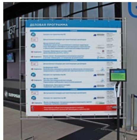
Конструкция 2x2 м