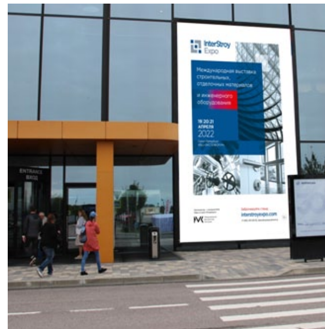
Реклама на части фасадного баннера, 4,8х4,24 м (полный размер фасадного баннера 5,24*9,36)