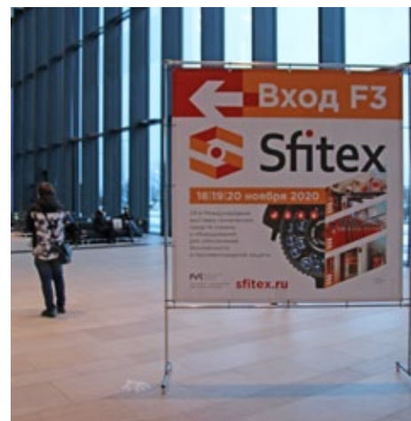
Конструкция 1,18x1,6 м