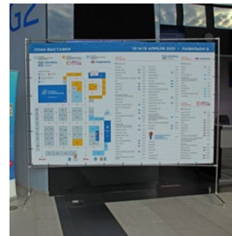
Конструкция 2,9x1,95 м